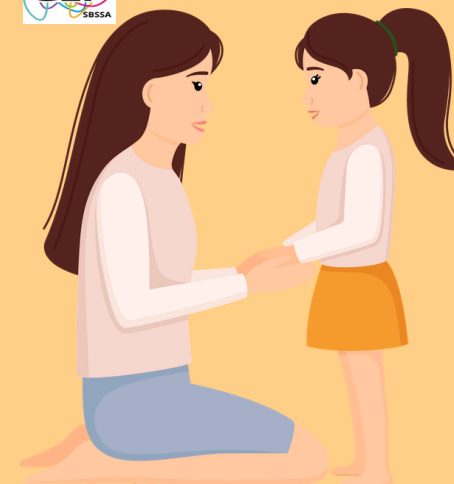
Questionnement de l'enfant