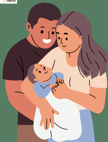
Transmissions du matin