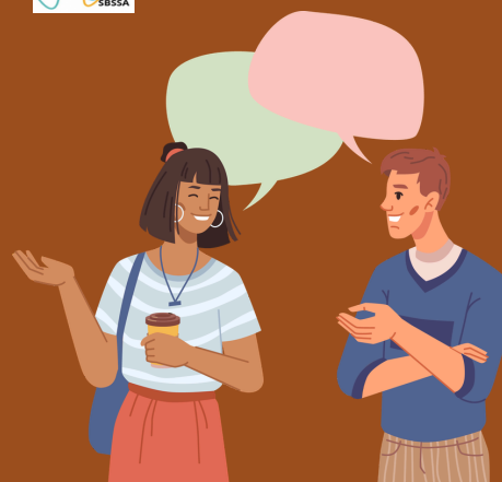
Questionnement de l'équipe