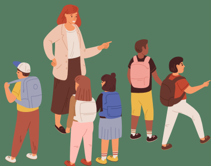
Questionnement des autres enfants