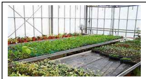
Une production respectueuse de l'environnement