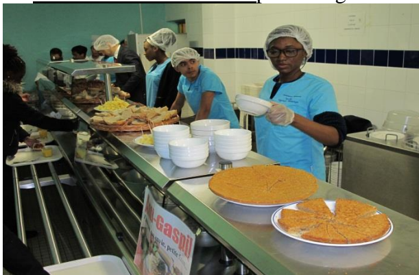
Service à la cantine