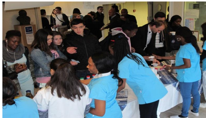
Service dans le hall