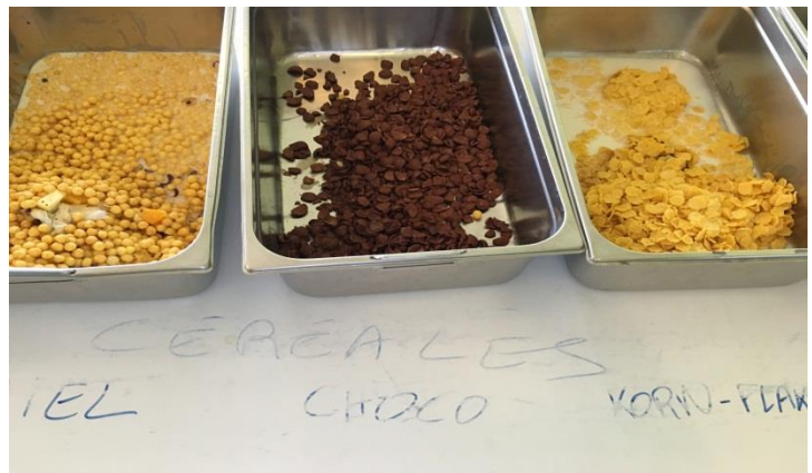
Récupération des restes alimentaires dans des bac gastro