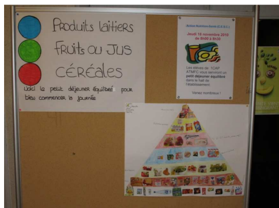
Document 1 : Affiches sur les groupes alimentaires

*Réaliser des cartes jeu sur les groupes alimentaires